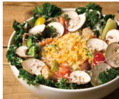
ケールとマッシュルームのシーザーサラダ