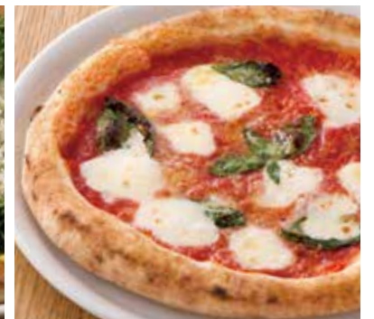
フレッシュトマトとバジルとのマルゲリータ