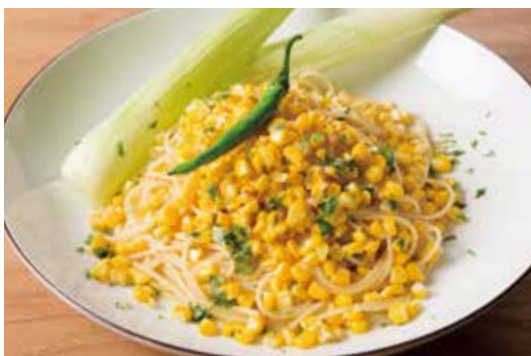
千葉県芦田さんのとうもろこし『ミルクスイーツ』と青唐辛子のペペロンチーノ

・ブレッド (イカスミパン) 250 (税込275) Bread (Squid ink bread)