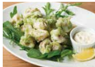
ヤリイカの青のりフリット