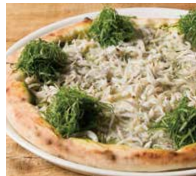
シラスと大葉、バジルのジェノベーゼ “KAMAKURA”

本日のピッツァ (スタッフへお尋ねください) 1,890 (税込2,079)~ Today's pizza *Please ask your waiter