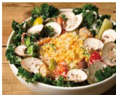
ケールとマッシュルームのシーザーサラダ