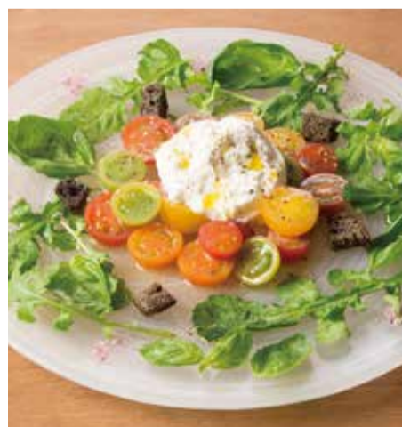
長野ベリーファームのカラフルトマトとモッツアレラチーズのカプレーゼ