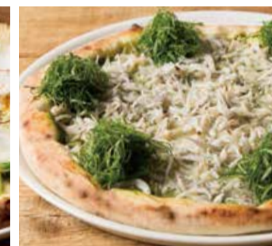
しらすと大葉、バジルのジェノベーゼ “KAMAKURA”