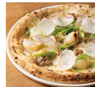
青森県産野辺地かぶと自家製サルシッチャのピッツァビアンカ