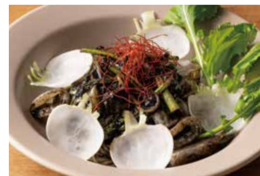
青森県産野辺地かぶとヤリイカのイカ墨ソース