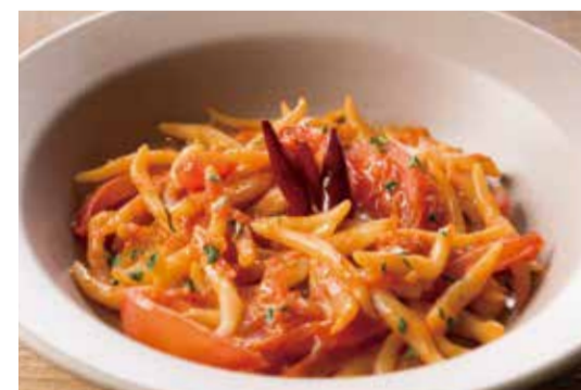
AW定番! 100%手作りトマトソースのトロフィエアラビアータ